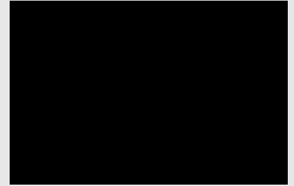
Miss America Latina in Italia 2014